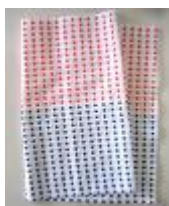
〈日本の伝統的な豆しぼり〉