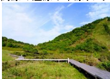
鏡ヶ成湿原とウグイス