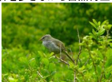
周囲の森は野鳥の楽園です。