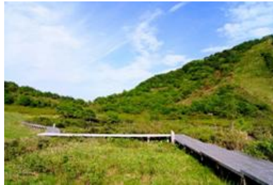
鏡ヶ成湿原とウグイス 周囲の森は野鳥の楽園です。