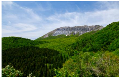
大山を代表する絶景 鍵掛峠から「大山南壁」豪円山から「大山北壁」