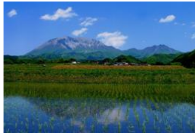
江府町貝田(かいだ)地区の水田に映る逆さ大山